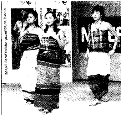
Projektarbeit: Misereor zeigte Mode aus Afrika und Asien.

„Kirche lebt in und mit dir“ war auf den auffälligen Halstüchern zu lesen, „Kirche lebt in uns und mit