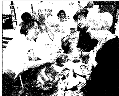
„Tag der Verbände“: Teilnehmer beim „Markt der Möglichkeiten“.