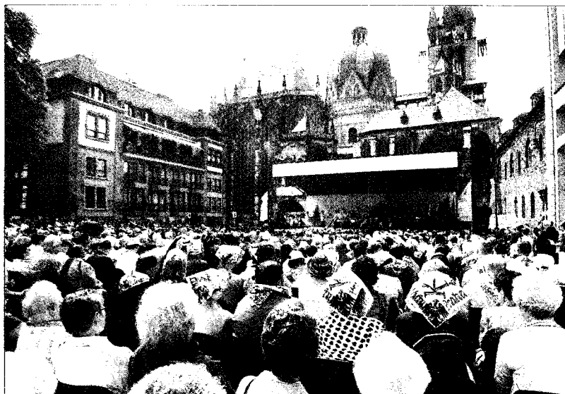
Der Katschhof ist bestens gefüllt: Bei der Pilgermesse hörten zahlreiche Gläubige dem Apostolischen Nuntius, Erzbischof Ender, zu.

Gestern feierte der Apostolische Nuntius in Deutschland, Erzbischof Dr. Erwin Josef Ender auf dem voll besetzten Katschhof eine Pilgermesse. Konzerte gaben dem ersten Heiligtumswochenende den kulturellen Rahmen.